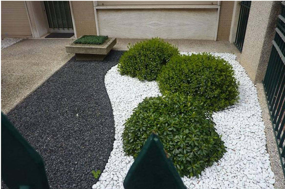
Schottergarten mit vereinzelt grünen Pflanzen

In den Gärten Deutschlands greift seit Jahren ein neuer Trend um sich. Statt sattem Grün und farbenfrohen Blüten ist die Farbe Grau auf dem Vormarsch. Mindestens 15% der deutschen Vorgärten werden mittlerweile mit Kies und Schotter gestaltet anstatt mit Rasen. 1 Bei den neu angelegten Vorgärten ist diese Zahl, auch in Berlin, deutlich höher.